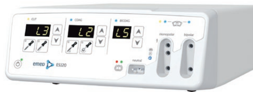
100-015 Aparat elektrochirurgiczny ES 120